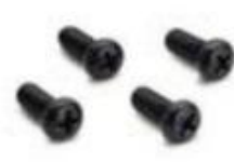
Parafusos: MR3 Conjunto com 4 peças