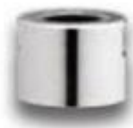
Porta Pinças MSCN1