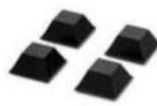
Pés de Borracha MR2 Conjunto com 4 peças