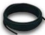
Mangueira de Ar AH6 - 8m - φ6.0