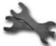
Chave Inglesa MSP1 Conjunto com 2 peças